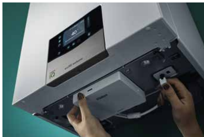
ecoTEC exclusive med internetmodulen sensoNET